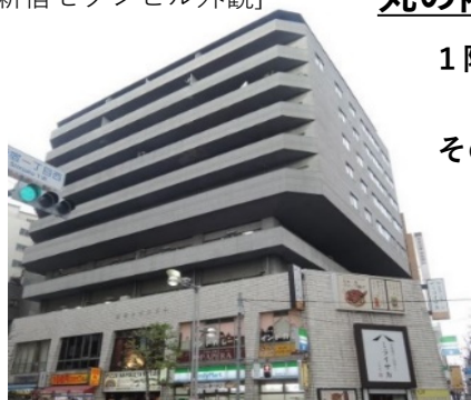
[新宿セブンビル外観]

※専用部分の光熱費等は、別途実費負担となります。 ※弊社指定の家賃保証システムにご加入いただきます。 ※弊社指定の家財保険にご加入いただきます。