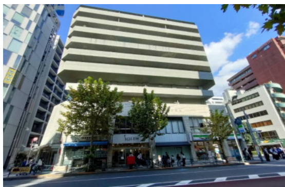
丸の内線 新宿御苑前駅 1番出口 目の前です