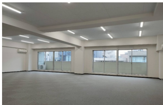
2024.10 リノベーション工事完了

※専用部分の光熱費等は、別途実費負担となります。 ※弊社指定の家賃保証・火災保険にご加入いただきます。