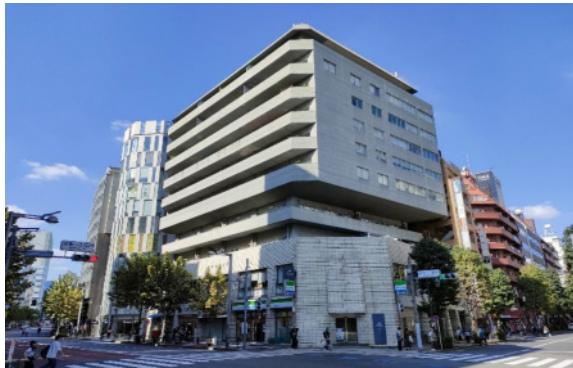
丸の内線 新宿御苑前駅 1番出口 目の前です