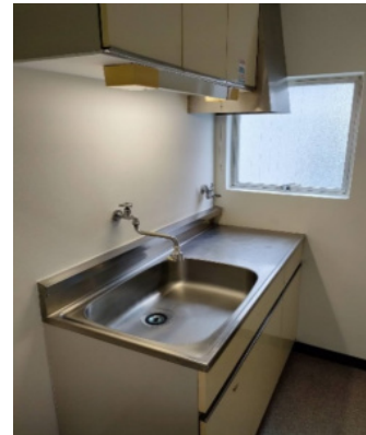
※図面と現状が異なる場合は現状優先となります。